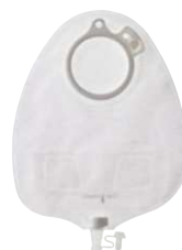
سیستم دوتکه – شیردار

در کولوستومیت‌ها استفاده می‌شود. کیسه‌ها باید پس از هر بار دفع تعویض شود اما چسب پایه می‌تواند حداکثر ۲ روز بر روی پوست بماند.