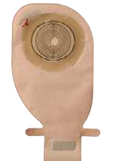
کیسه‌های یک تکه – ته باز