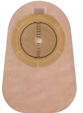
کیسه‌های یک تکه – ته بسته

این کیسه‌ها خود به سه شکل ته بسته، ته باز و شیردار می‌باشد :