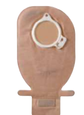
سیستم دوتکه – ته باز