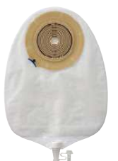
کیسه‌های یک تکه – شیردار

در کولوستومیت‌ها استفاده می‌شود و باید پس از هر بار دفع تعویض شود.