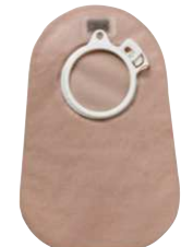
سیستم دوتکه – ته بسته

این کیسه‌ها خود به سه شکل ته بسته، ته باز و شیردار می‌باشد :